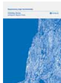
Simon Critchley ΣΗΜΕΙΩΣΕΙΣ ΠΕΡΙ ΑΥΤΟΚΤΟΝΙΑΣ

Οι περιπτώσεις των ποπ σταρ συνδέονται με τη λεγόμενη «φαντασίωση αθανασίας»;